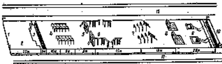
Єдина смуга перешкод

10. Єдина смуга перешкод , призначена для подолання горизонтальних і вертикальних перешкод індивідуально і в складі підрозділу, метання гранат на влучність. При відсутності смуги у навчальному закладі допускається проведення занять на місцевості, дообладнаній перешкодами і мішенями. Така місцевість повинна забезпечити подолання окремих природних, штучних перешкод (елементів смуги) висотою до 2 м різними способами (стрибки, перелітання), рух по вузькій опорі на незначній висоті (до 1 м), вистрибування із заглиблень, інші прийоми і дії.